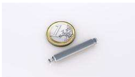
Taille du stimulateur Nanostim comparé à une pièce d'un Euro - St. Jude Medical, Inc.

CHU de Grenoble, vendredi 13 décembre 2013